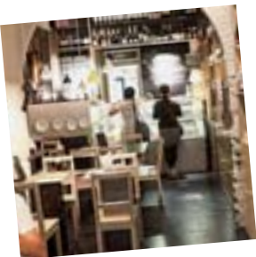
Nel cuore dell'Oltrarno ci si serve da soli e il menù è anche vegano

Posto semplice, ma intelligente. Vivanda è una piccola tavola calda-fredda nel cuore d'Oltrarno. Ci si serve da soli ordinando al banco, riempiendosi il bicchiere dai vini in mescita e poi ci si fa il caffè. Oltre a qualche tagliere di salumi (spagnoli, cinta senese e salumi di allevamenti bio toscani) e a piatti freddi come carpacci e insalate, si ordinano anche piatti caldi come polpette di melanzane,